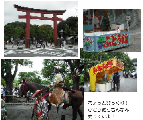
ちょっとびっくり! ぶどう飴とぎんなん 売ってたよ!